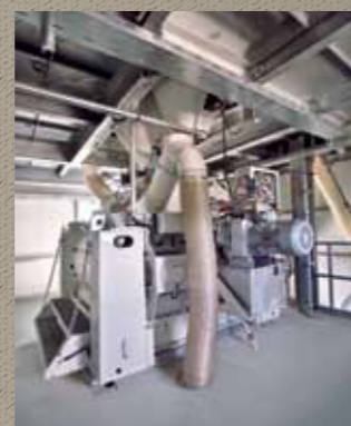
» Malaxeur à double arbre