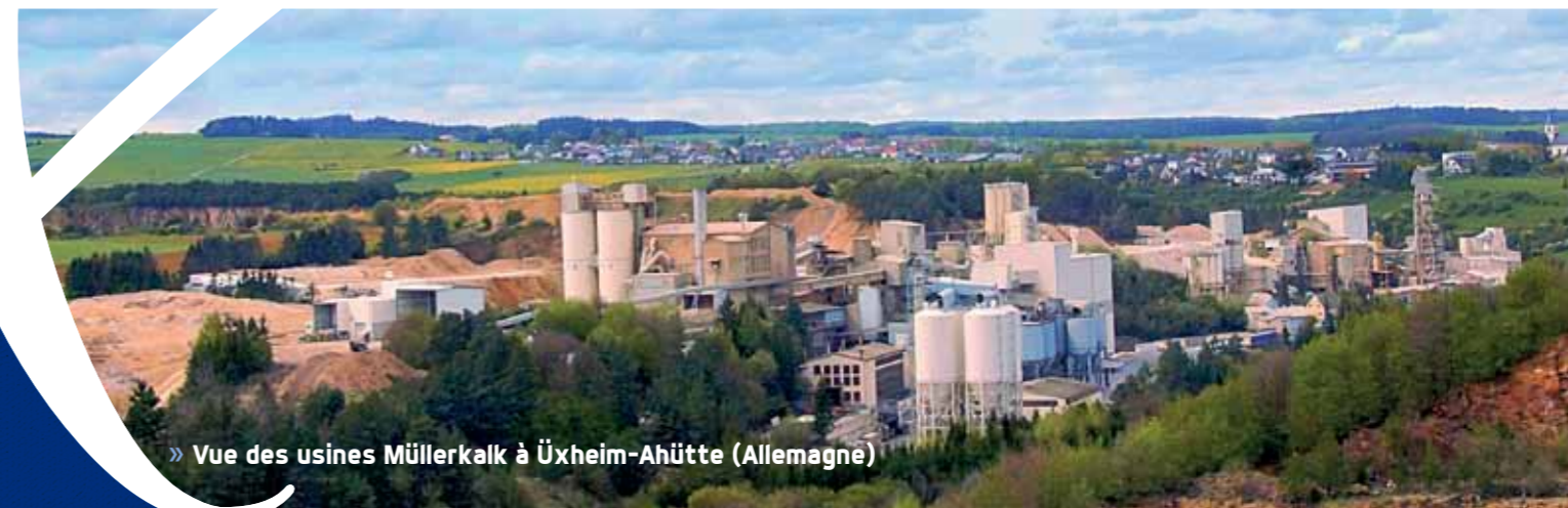
» Vue des usines Müllerkalk à Üxheim-Ahütte (Allemagne)