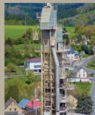
» Four à chaux

5 » Fraiseuse de sol en cours d'utilisation