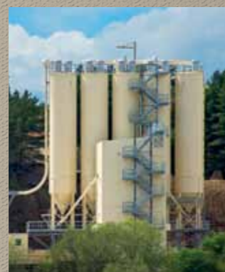
» Installation de mélange